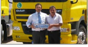
Karalar DAF dedi